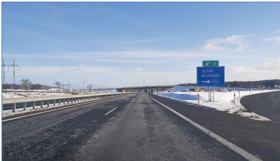
Fotografie obchvatu po dokončení výstavby

V období od června 2016 do dubna 2017 jsme pomohli ateliéru dopravních staveb firmy VPÚ Deco Praha, a. s. zpracovat pro ŘSD prováděcí projekt souboru vodohospodářských staveb na dálnici D6, obchvatu Krušovic a Řevničova. Celkem se jednalo o 11 stavebních objektů, 4 úseky středové kanalizace, přeložku Loušetínského potoka, 3 dešťové vsakovací nádrže, 1 retenční nádrž, úpravu meliorací v okolí dálnice, a úprava zatrubnění napájení soukromého rybníka. Spolupráce s Ateliérem dopravních staveb VPÚ Deco Praha a.s., a především s ŘSD, který se ukázal jako velmi profesionální zadavatel, nám pomohla rozšířit, zlepšit a zkvalitnit naše služby a zjistit, jak se spolupracuje s největším zadavatelem v oboru dopravních staveb v ČR, což nám pomohlo k celkovému zdokonalení našich služeb.