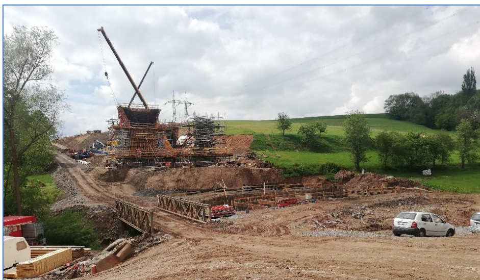
Fotografie v průběhu výstavby